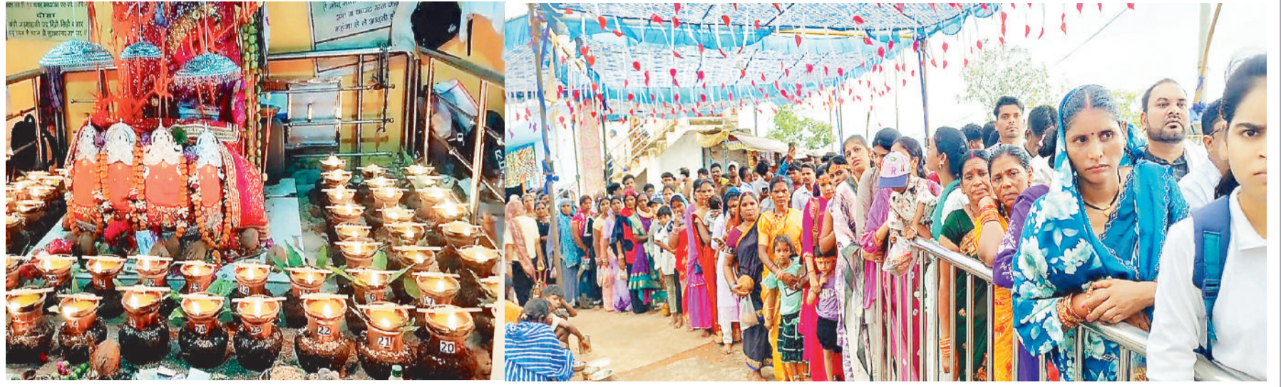
पहाड़ों में विराजित मां मड़वाराणी।