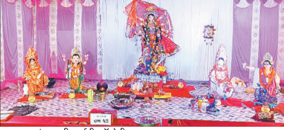
सुपर एफ पंडाल सीएसईबी कॉलोनी।