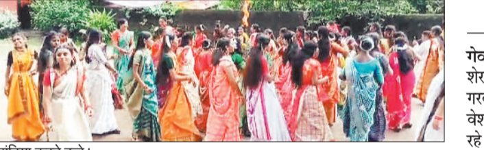
डांडिया करते बच्चे।