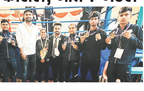
जिले के बाक्सर्स ने देवभूमि में दिखाया कौशल, जीते 7 मेडल