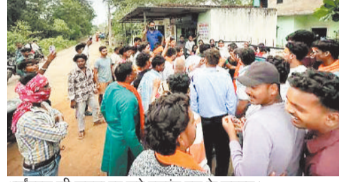
धर्मांतरण की सूचना पर जुटे बजरंग दल के सदस्य।