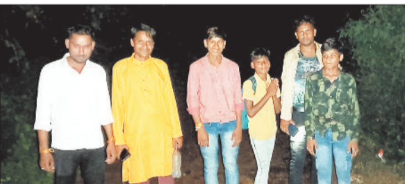
हरिभूमि न्यूज ►► बरपाली

पहाड़ों वाली मां मड़वाराणी का दरबार सज चुका है। मां मड़वाराणी के दर्शन करने भक्त बड़ी संख्या में पहुंच रहे हैं। भक्तों को बहुत सी समस्याओं का सामना करना पड़ रहा है। पानी के समस्ये तो माता के दरबार के लिए कोई नई समस्या नहीं है इस समस्या से तो माता के दरबार में आने वाले भक्तों जड़ना ही पड़ता है पर इस बार एक और नई समस्या भक्तों को परेशान कर रही है। सूर्यास्त के बाद माता के दरबार में जाने वाले तथा आने वाले भक्त जंगली जानवरों से भरे रास्ते पर अंधेरे में आने जाने को विवश है, क्योंकि क्रेडा विभाग के द्वारा पहाड़ के नीचे से लेकर माता के दरबार पर जो लाइट लगाई गई थी वो खराब हो चुकी है और विभाग को इसकी सुध लेने का समय नहीं मिल रहा है और शायद जब तक विभाग अपनी कुंभकर्णीय निद्रा से जागेगा तब तक मां मड़वाराणी के दरबार में नवरात्रि का पर्व समाप्त हो जाएगा। ज्ञात हो कि मां मड़वाराणी के