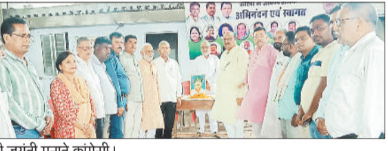
भगत सिंह की जयंती मनाते कांग्रेसी।