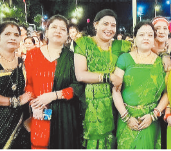
गरबा करने पहुंची महिलाएं।