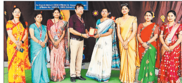
कार्यक्रम में उपस्थित शिक्षिकाएं।