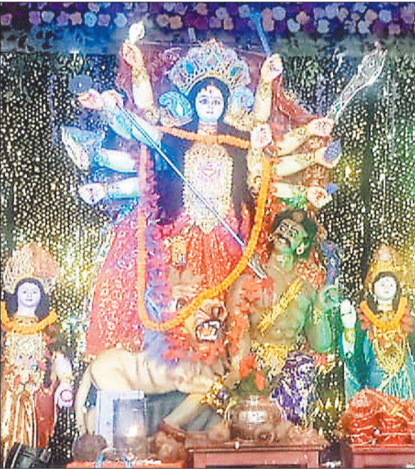
रामपुर हाउसिंग बोर्ड कॉलोनी दुर्गा उत्सव समिति पुराना पंडाल।