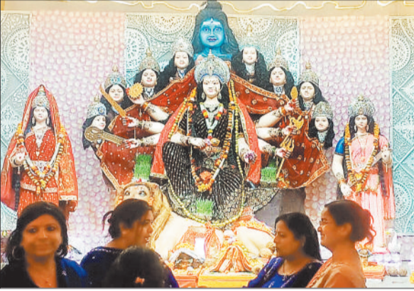
टीपी नगर कोरबा।