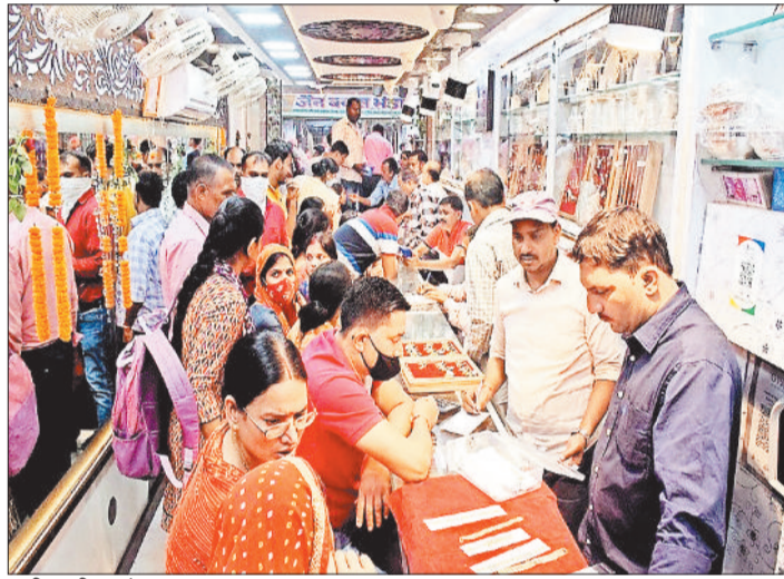
खरीदारी करते ग्राहक।

त्योहारी में कर्मचारियों को मिलने वाली बोनस पर बाजार की नजर टिकी है। इस पैसे से बाजार में तेजी आएगी। जब में नोट आने से लोग खुब खरीदारी करेंगे। इसके लिए बाजार खुद को तैयार करने लगा हुआ है। आँटो मोबाइल सेक्टर से लेकर सराफा और कपड़ा से लेकर लेक्ट्रोनिक्स बाजार में कारोबार की उम्मीद बंधी है। व्यापारी कारोबार में उछाल आने की उम्मीद कर रहे हैं। आँटो मोबाइल सेक्टर में अभी से खरीदी के लिए गाड़ियों की बुकिंग चालू हो गई है। जिले में सार्वजनिक व निजी कारखानों में लगभग 18 से 20 हजार कर्मचारी काम करते हैं। इसमें करीब 8 से 10 हजार कर्मचारी हजार कर्मी कोयला खदान, एनटीपीसी, विद्युत कंपनी और बालको में नियोजित हैं। इन्होंने उपक्रमों में काम करने वाले नियमित कर्मचारियों को सबसे ज्यादा बोनस मिलती है। एक अनुमान के अनुसार इस बार इन कर्मियों के बीच लगभग 1 अरब रुपए से अधिक