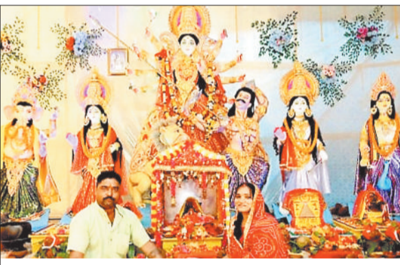
दुर्गा पूजा एवं दशहरा उत्सव समिति कोसाबाड़ी कोरबा।